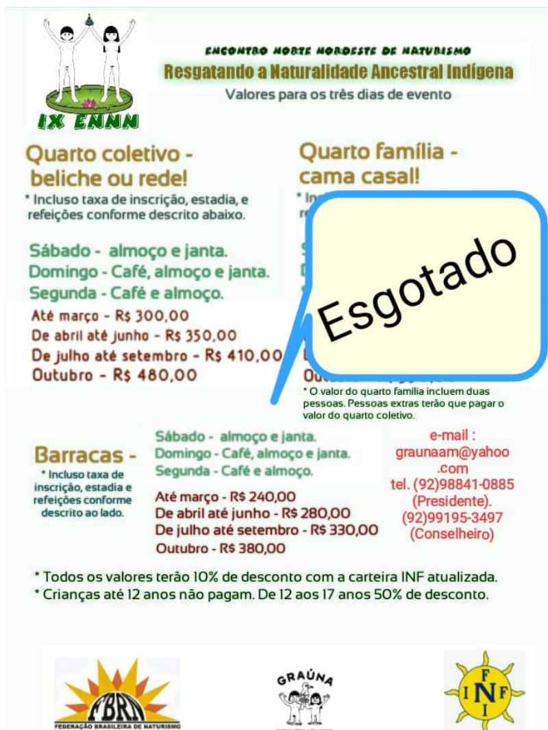
Figura 1 - Valores da inscrições, incluindo acomodações e alimentação.

Manaus vai sediar durante os dias 10, 11 e 12 de outubro, no sítio Canarinho (zona rural de Manaus), o IX Encontro Norte Nordeste de Naturismo (ENNN 2020). Inscrição, hospedagem e alimentação estão inclusos em um único valor para os três dias de evento, conforme detalhamento na figura 1. Durante o evento, estão programados palestras, vivências, plenárias, visitas, atividades recreativas e culturais,